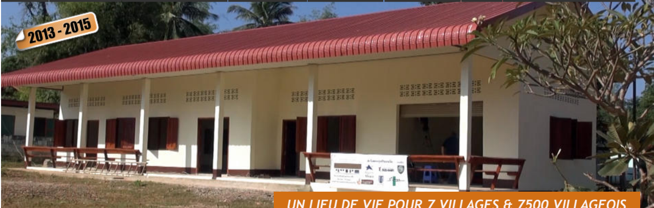
UN LIEU DE VIE POUR 7 VILLAGES & 7500 VILLAGEOIS